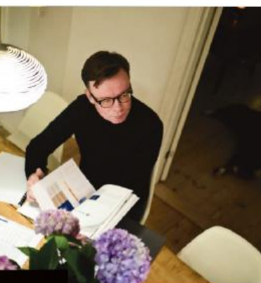
Thorsdag 14. september 2017